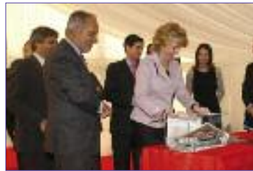
Aguirre y Parro colocan la primera piedra del IMDEA de la Energía. Pág. 7