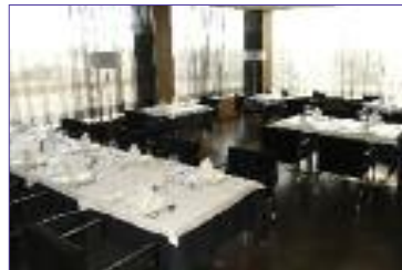
Restaurante Hotel NH de Móstoles, pág. 30