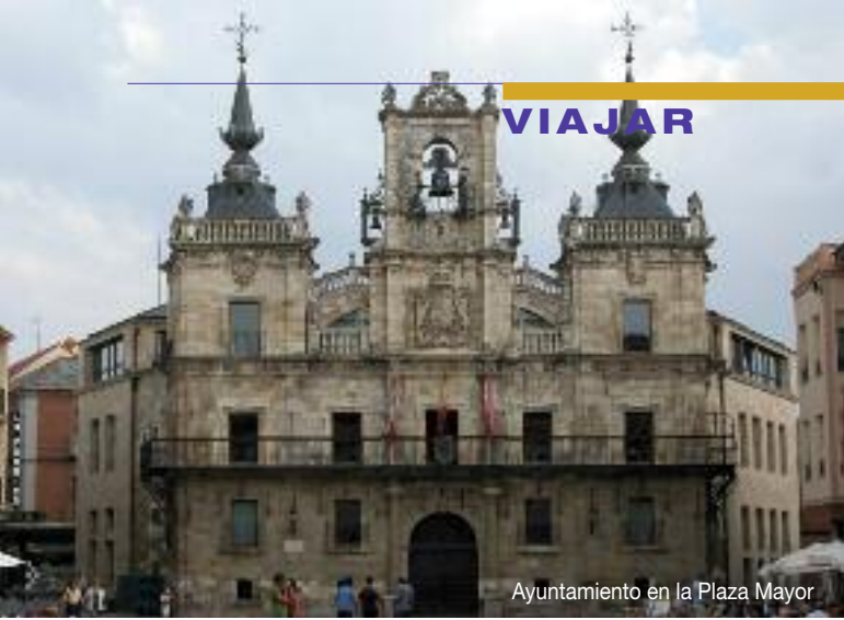
Ayuntamiento en la Plaza Mayor