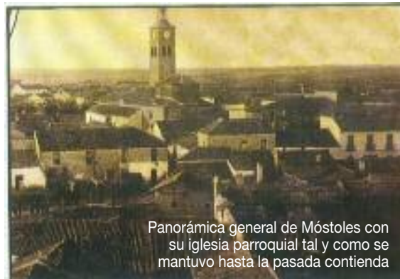
Panorámica general de Móstoles con su iglesia parroquial tal y como se mantuvo hasta la pasada contienda

Hemos de subrayar que el polígono industrial nº 1 contaba ya a mediados de la década de los 70 con 92 industrias. Pero a estas alturas, ya había echado a andar el polígono nº 2. Las industrias instaladas en el polígono 1 habían proporcionado unos cinco mil puestos de trabajo, por lo que muchos de los vecinos de Móstoles no tenían ya necesidad de acudir a trabajar a la Capital (éxito que recaía en el Sr. Alcalde y sus respectivos regidores, técnicos y adyacentes). Entre las industrias que funcionaban en nuestra Villa, había fábrica de juguetes, de aparatos de aire acondicionado o de la marca Forlady de muebles de cocina, que era de El Corte Inglés y que fue de las primeras si no la primera fábrica que se instaló en nuestra Villa.