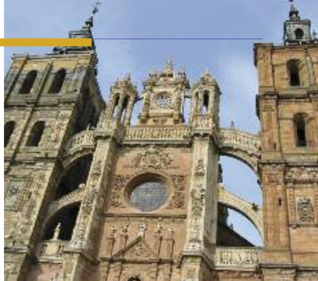
Catedral de Santa María

cloacas y posteriormente, las Termas Mayores y Menores. El siguiente punto es el foro, que coincidía en parte con la actual Plaza Mayor. En la plaza de los Padres Redentoristas, cercana a la Plaza Mayor, se encuentra la Ergástula, que acoge el Museo Romano de la ciudad.. Ya por último, y envolviendo el casco antiguo, que se ubica en una colina, se encuentran las murallas, que se asientan sobre sus precedentes romanas del siglo III.