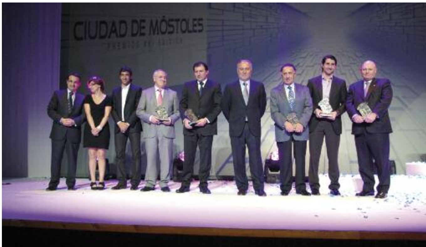
Premiados y autoridades después de la entrega de los premios.