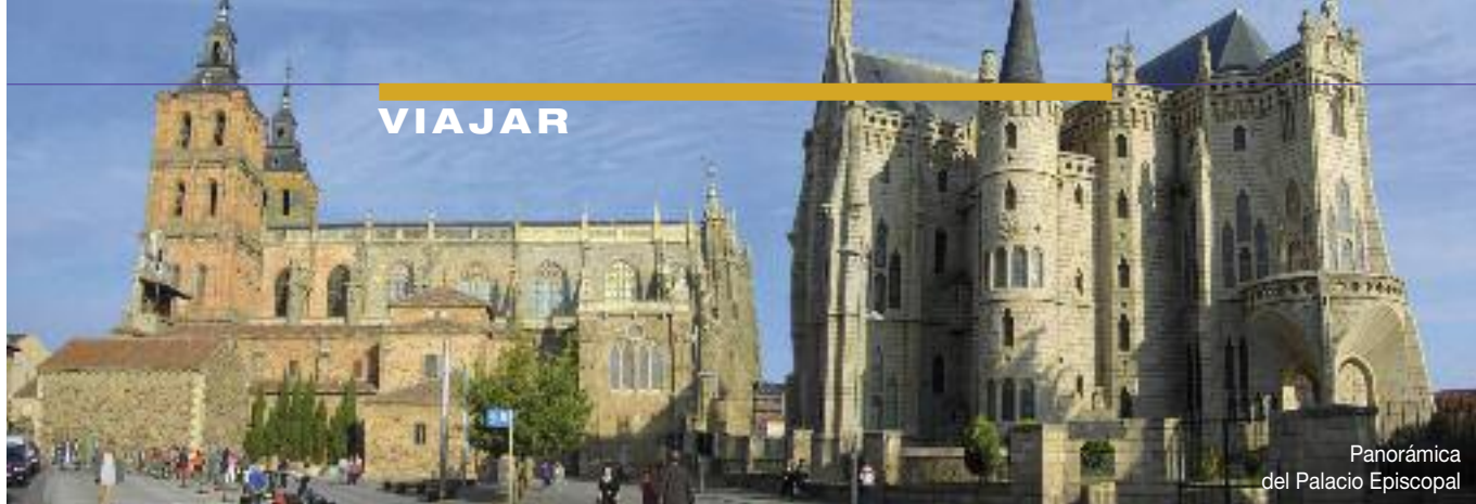
Panorámica del Palacio Episcopal

ción a Santiago de Compostela, nuevo modelador urbano y mercantil. Se percibe un incremento de población, entre la que aparecen inmigrantes extranjeros de diversas procedencias. La ciudad crece a extramuros, adosándose a las murallas nuevos arrabales como los de San Andrés, Rectivía y Puerta de Rey. El desarrollo de estos barrios imprime un mayor dinamismo económico y social y aumenta la complejidad funcional de la ciudad.